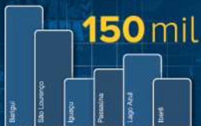
Grandes Parques e Praças Frequentadores - finais de semana

80% Crescimento em número de participantes diretos